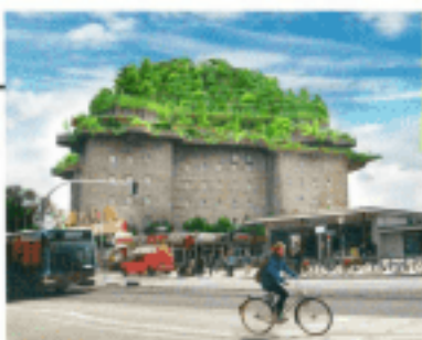
Der Hochbunker in Hamburg im spektakulären Modell